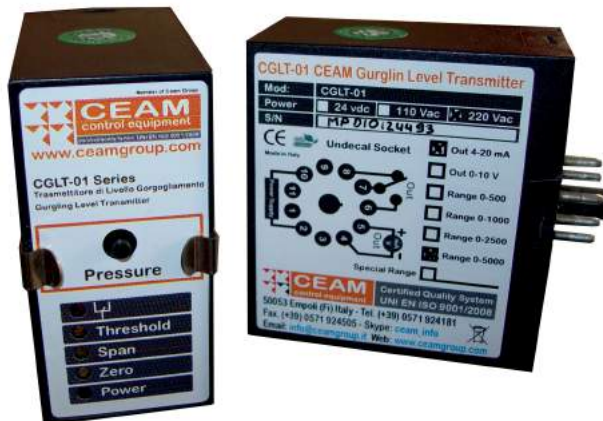
Nella Foto Dx: CGLT-01

CGLT-01 è disponibile con singola e doppia uscita relè e uscita analogica 0/4-20 mA oppure 0-10 Vdc.